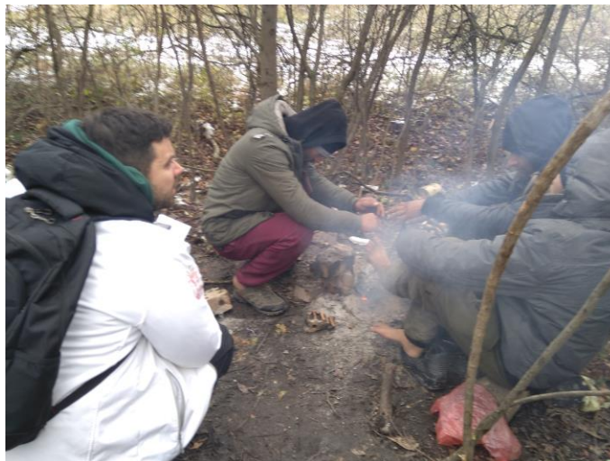
Slika 2: Pravnik APC/CZA razgovara sa maloletnicima bez pratnje o smeštaju u kamp

Nadležni tvrde suprotno navodima migranata.