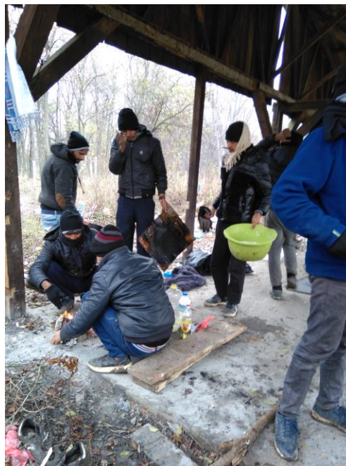
Slika 1: Grupa maloletnika bez pratnje, decembar 2017, Sombor

Direktor Centra za zaštitu i pomoć tražiocima azila (APC) Radoš Đurović zaključio je da nadležne institucije u Srbiji ne znaju koliko ukupno migranata ima na teritoriji zemlje, te da se shodno tome ni ne zna koliko ima maloletnika bez pratnje u zemlji. On je tvrdio da MUP nema podatke ni o najvećem broju ljudi koji su smešteni u centre za prihvatanje izbeglica, kao ni o ljudima koji borave izvan centara, zato što registracija i evidentiranje svih tih ljudi nije formirano kao uniformna praksa i ne sprovodi se na terenu. „Sasvim sigurno da je izvan centara mnogo više maloletnika bez pratnje od onog broja koji je uspeo da izrazi nameru za azil“, kazao je Đurović. Upozorio je da maloletni migranti bez pratnje imaju problem da izraze