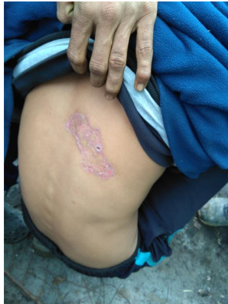
Slika 3: Maloletnik bez pratnje sa vidnom ranom od napada mađarske granične policije

Takođe, nismo uspjeli da utvrdimo da li migranti prijavljuju sporne slučajeve, ili ako ih ne prijavljuju zašto to ne čine. Ostalo je upitno da li možda poučeni nekim ranijim ličnim ili iskustvom prijatelja smatraju da nema svrhe ili pak prijavljuju, ali izostaju reakcije.