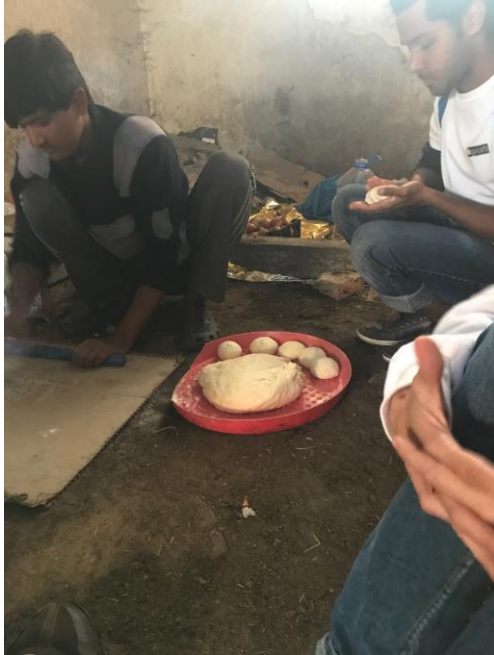
Picture 9: Maloletni migranti iz Avganistana spremaju ručak u napuštenoj zgradi u okolini Subotice

Na pitanje da li je osoblje obučeno za rad sa njima i sa kojim problemima i poteškoćama se suočavaju socijalni radnici, iz Ministarstva smo dobili samo odgovor, da Srbija obezbeđuje permanentnu edukaciju i usavršavanje socijalnih radnika. „Trenutno postoji manji broj stručnih prevodilaca od optimalnog, međutim ovo se nikako ne odražava na kvalitet pružanja usluga maloletnim migrantima bez pratnje. Bez obzira na okolnosti, Republika Srbija je usredsređena na povećanje broja stručnih prevodilaca”, navelo je Ministarstvo za rad, boračka i socijalna pitanja.