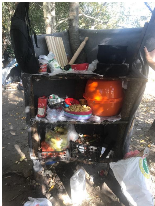
Picture 8: Uslovi za život maloletnih migranta bez pratnje koji žive na otvorenom

u njihove nadležnosti zbog čega ta grupacija ostaje bez socijalne zaštite. „Komesarijat se nameće kao neka vrsta potpunog autoriteta u upravljanju i tretiranju izbeglica i migranata na našoj teritoriji. Predstavnici Komesarijata mešaju se u procenu uzrasta deteta, često odbijaju da smeste decu u određene centre, često sprečavaju decu da odu da se upišu u škole, često deci diktiraju broj časova koje deca mogu da imaju u školi, i tako dalje ...”, kazao je Đurović. Objasnio je da radnici APC-a često kontaktiraju terenske socijalne radnike da bi se određenim maloletnicima bez pratnje dodelili privremeni staratelji i da bi ih smestili u neki od centara, ali da socijalni radnici pošto procene uzrast osobe najčešće govore da moraju da se konsultuju sa predstavnicima Komesarijata oko toga da li su saglasni sa procenjenim uzrastom osobe i da li osoba može da bude smeštena u određeni centar.